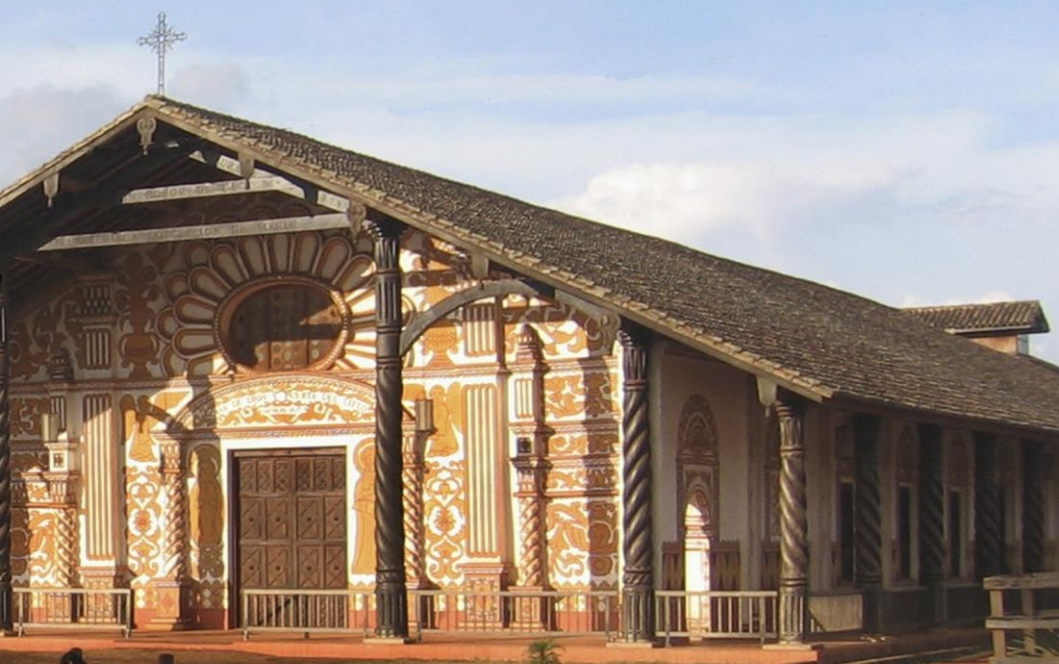
Catedral de la Inmaculada Concepción - Misiones Jesuíticas de Chiquitos