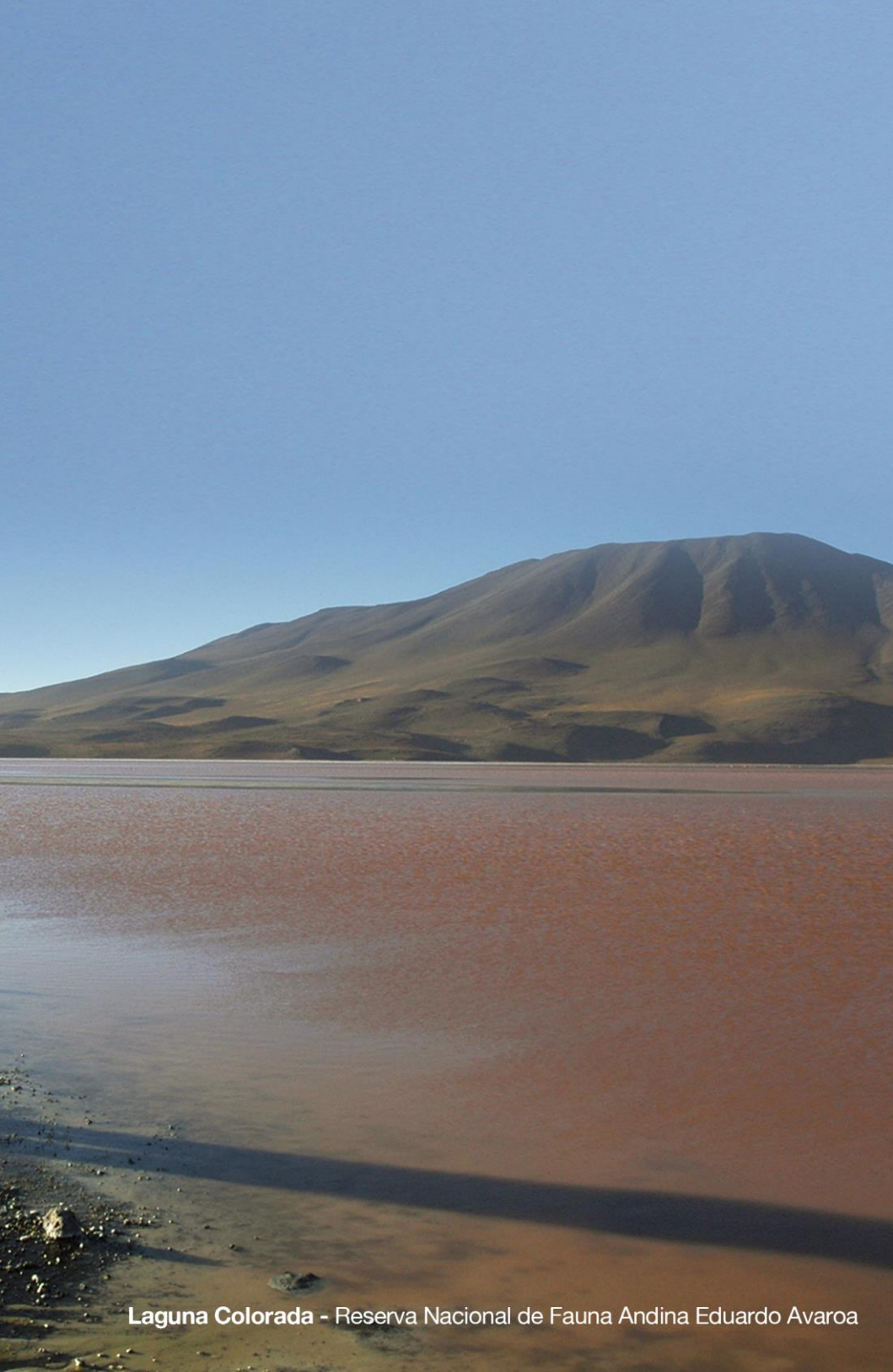
Laguna Colorada - Reserva Nacional de Fauna Andina Eduardo Avaroa