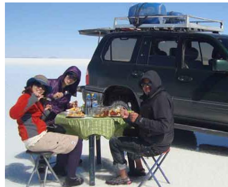
Los servicios que se ofrecen para disfrutar del Salar de Uyuni (alojamiento, alimentación o transporte turístico exclusivo) son parte de la planta turística.