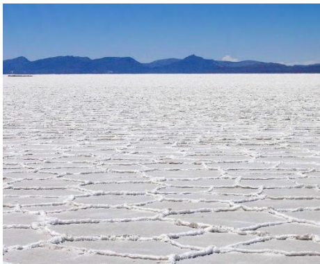
El Salar de Uyuni, por los paisajes, la singularidad y sus características en un atractivo turístico.